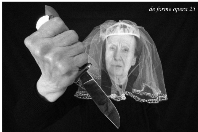
de forme opera 25