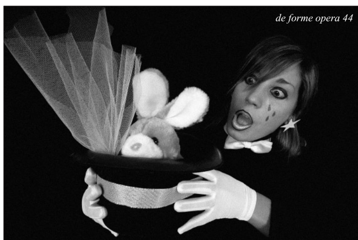
de forme opera 44

Stanghella scuole Elementari Anno scolastico 2004-2005