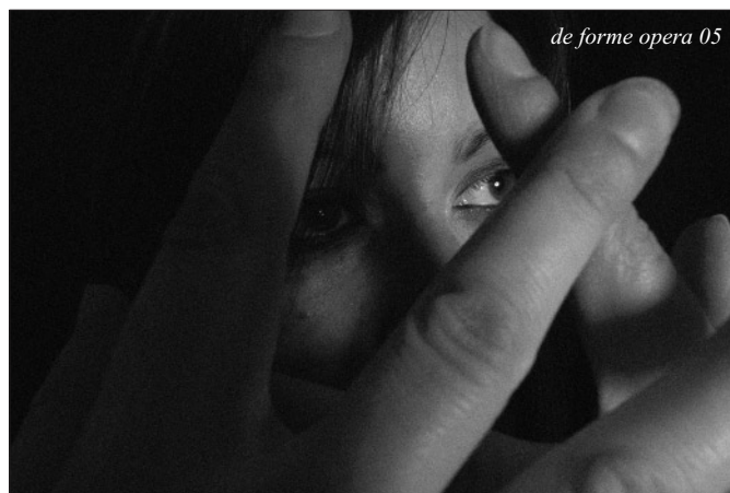
de forme opera 05