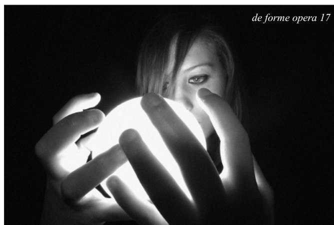
de forme opera 17